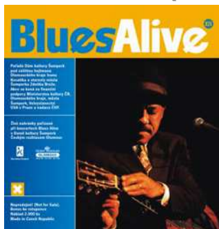
BA 2006 Live CD (1 track)