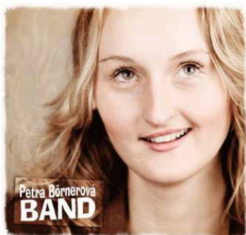
2008 studio CD